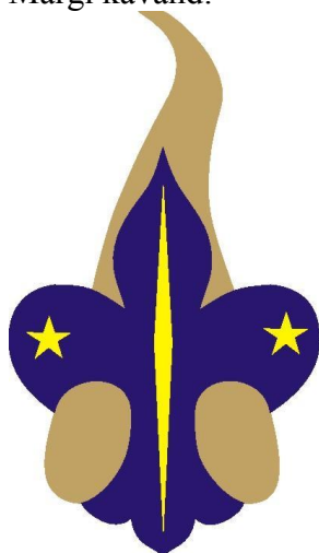
I järk kuld