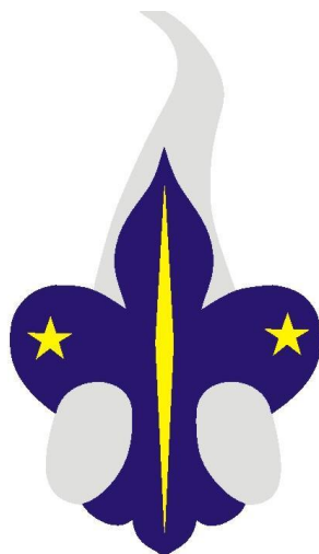
II järk hõbe